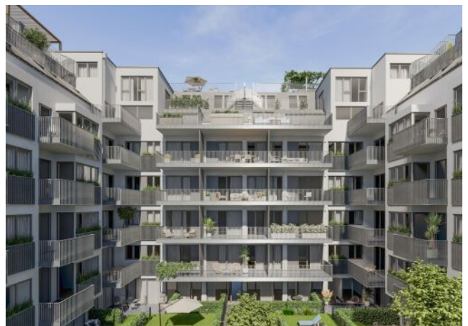
Herbststraße 6-10 | Innenhof | Tag