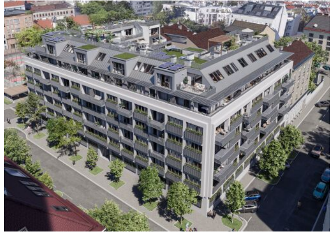
Herbststraße 6-10 | Vogelperspektive