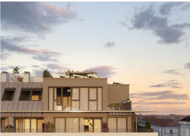
Herbststraße 6-10 | Außenansicht | Dämmerung