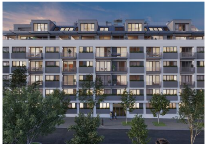
Herbststraße 6-10 | Außenansicht | Nacht