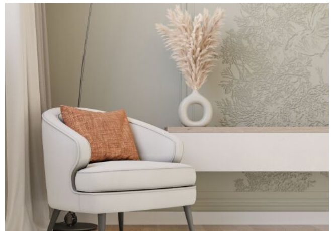
Herbststraße 6-10 | Detailansicht