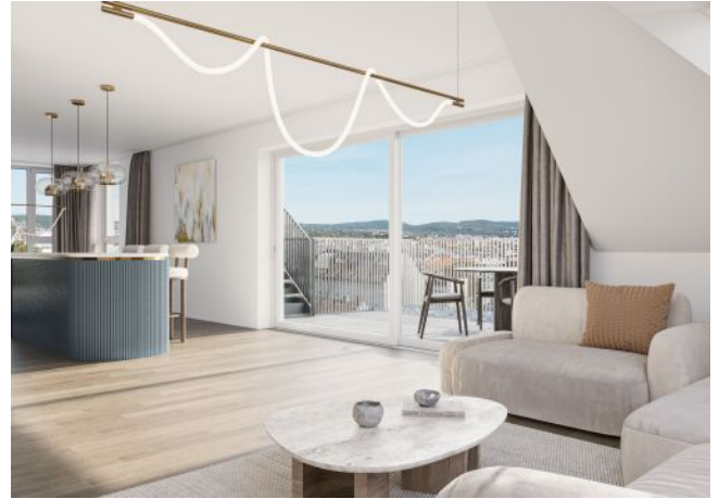
Herbststraße 6-10 | Wohnküche