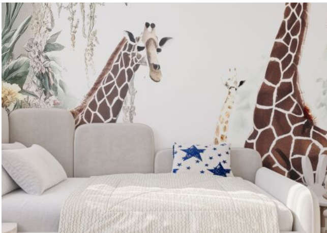
Herbststraße 6-10 | Kinderzimmer