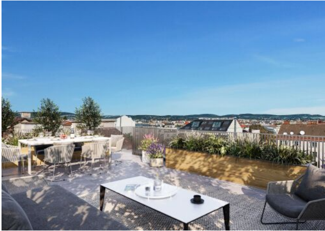
Herbststraße 6-10 | Dachterrasse