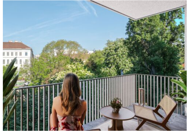
Herbststraße 6-10 | Aussicht