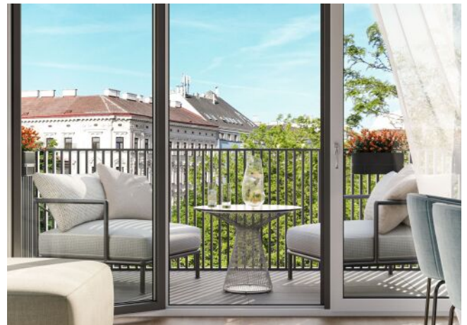
Herbststraße 6-10 | Balkon