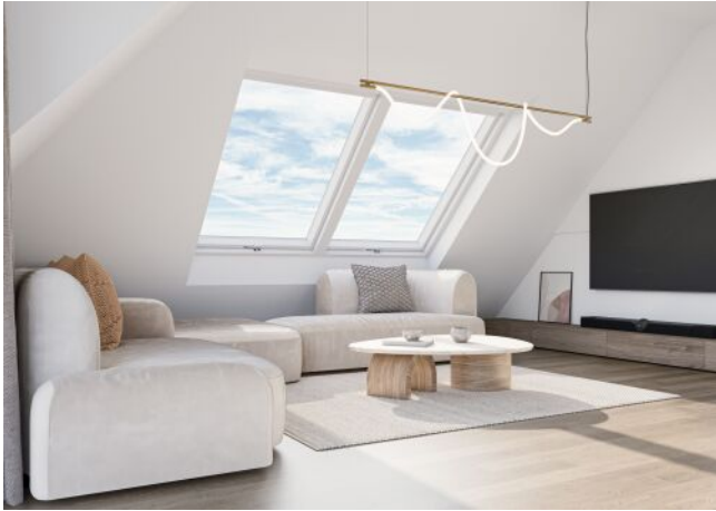
Herbststraße 6-10 | Wohnküche