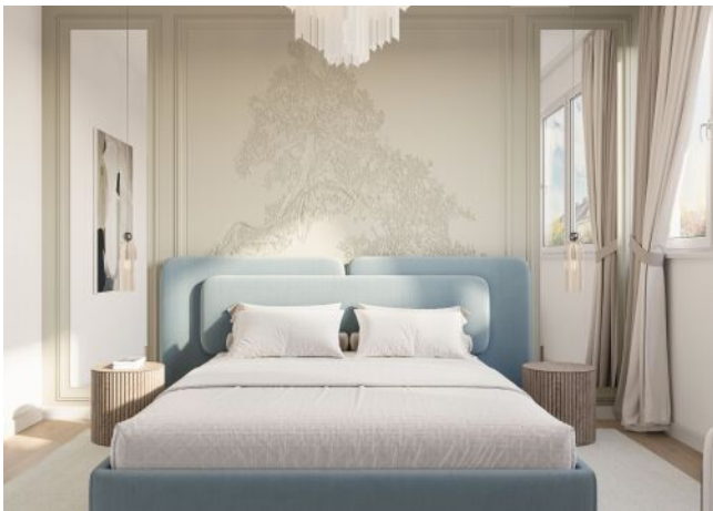
Herbststraße 6-10 | Schlafzimmer