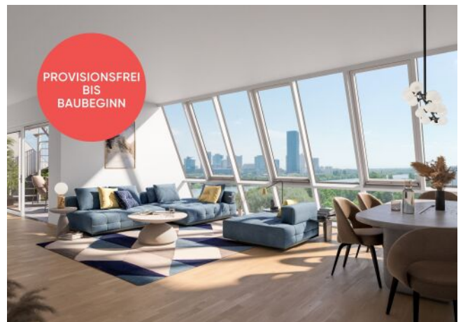
Traisengasse 20-22 | Wohnraum DG