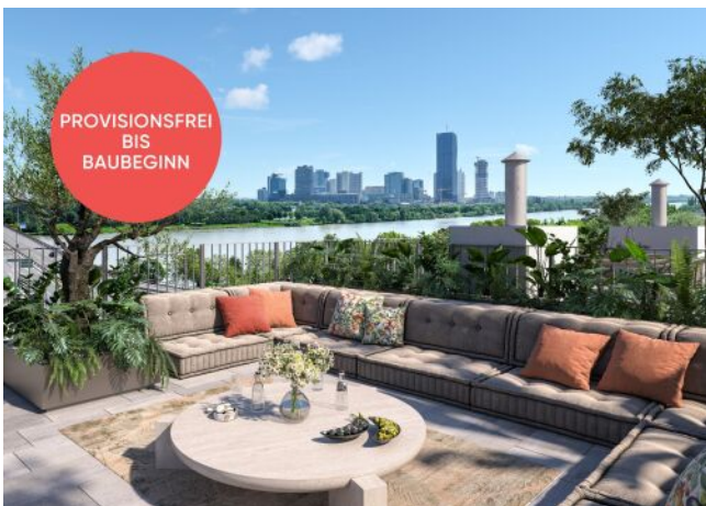
Traisengasse 20-22 | Dachterrasse