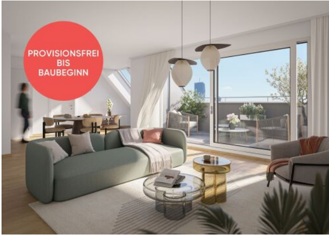
Traisengasse 20-22 | Wohnraum