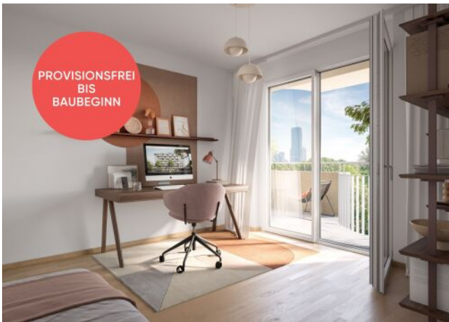
Traisengasse 20-22 | Homeoffice