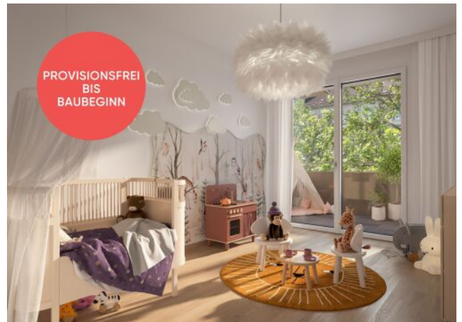
Traisengasse 20-22 | Kinderzimmer