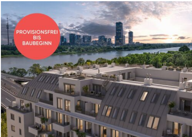
Traisengasse 20-22 | Fassade Donau