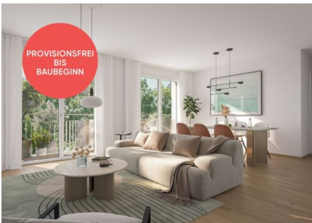
Traisengasse 20-22 | Wohnraum