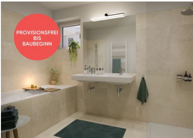
Traisengasse 20-22 | Badezimmer