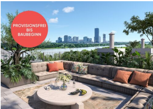
Traisengasse 20-22 | Dachterrasse