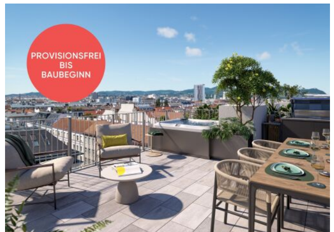
Traisengasse 20-22 | Dachterrasse