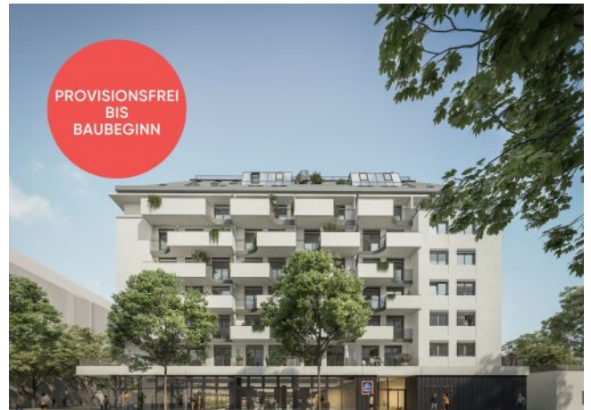
Traisengasse 20-22 | Fassade Tag