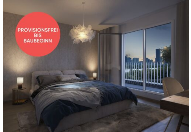
Traisengasse 20-22 | Schlafzimmer