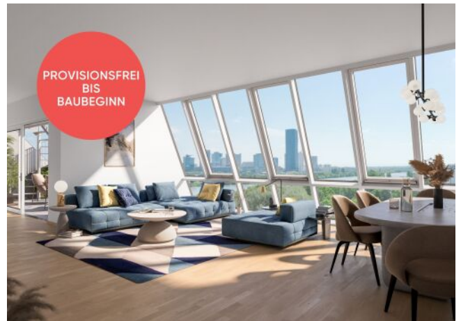
Traisengasse 20-22 | Wohnraum DG