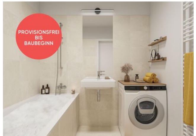
Traisengasse 20-22 | Badezimmer