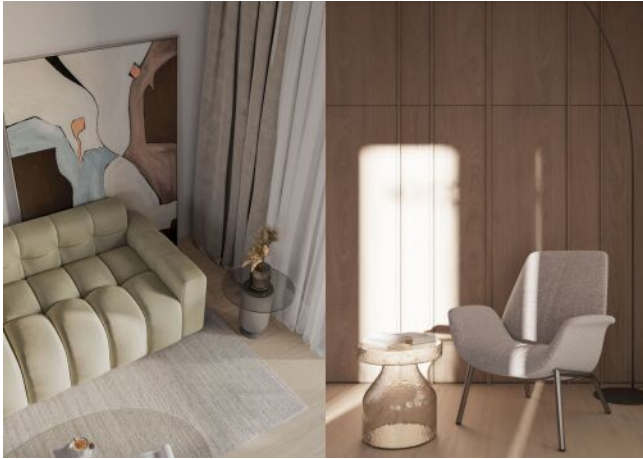
WINEGG-Siebenbrunnengasse 44 - Detail