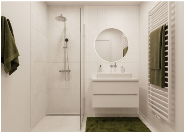
WINEGG-Siebenbrunnengasse 44 - Bad mit Dusche