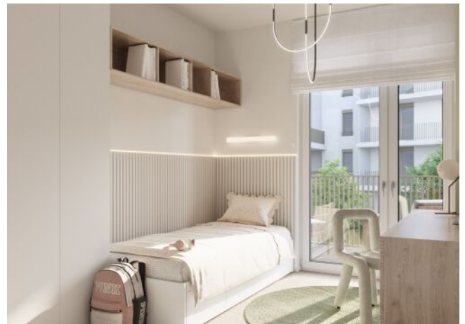
WINEGG-Siebenbrunnengasse 44 - Zimmer