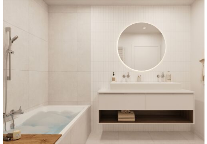
WINEGG-Siebenbrunnengasse 44 - Bad