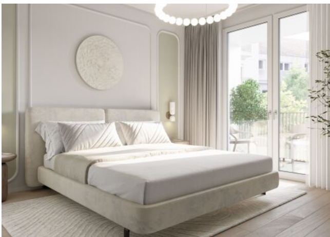
WINEGG-Siebenbrunnengasse 44 - Zimmer