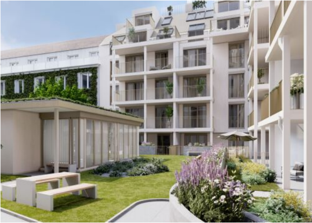
WINEGG-Siebenbrunnengasse 44-Garten Innenhof