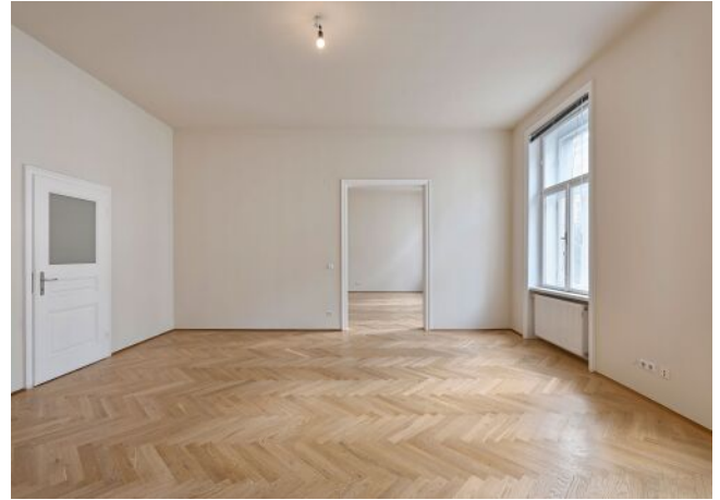
Wohnzimmer Blick ins Schlafzimmer