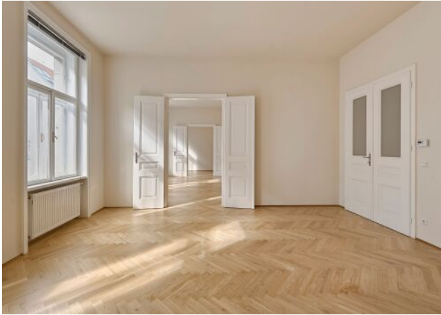
Blick vom Schlafzimmer ins Wohnzimmer