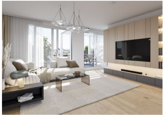
Visualisierung Top 21