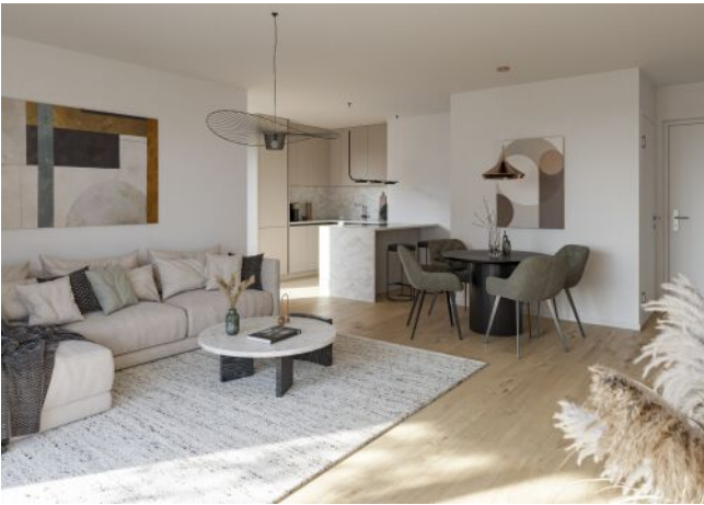
Visualisierung Top 15