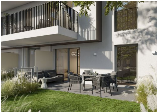
Visualisierung Top 2