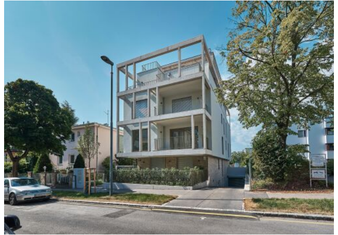
Greenhill Suites | Fassade