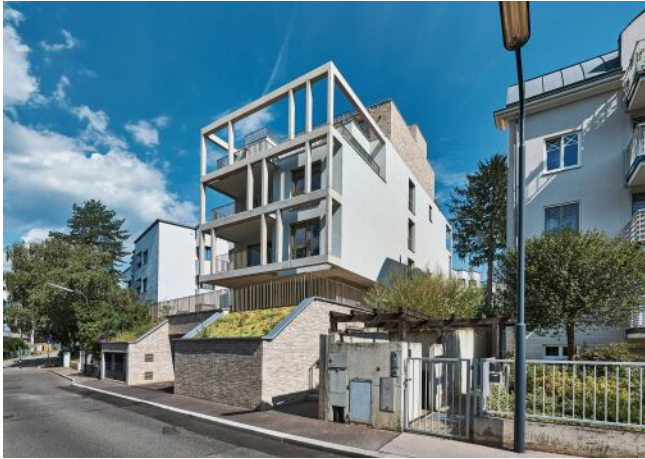
Greenhill Suites | Fassade