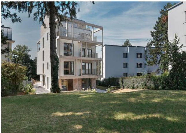
Greenhill Suites | Fassade