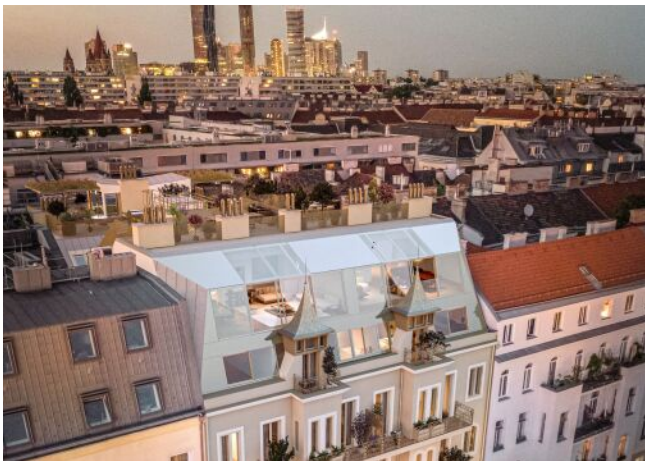
Ausstellungsstraße 29 | Außen Abend