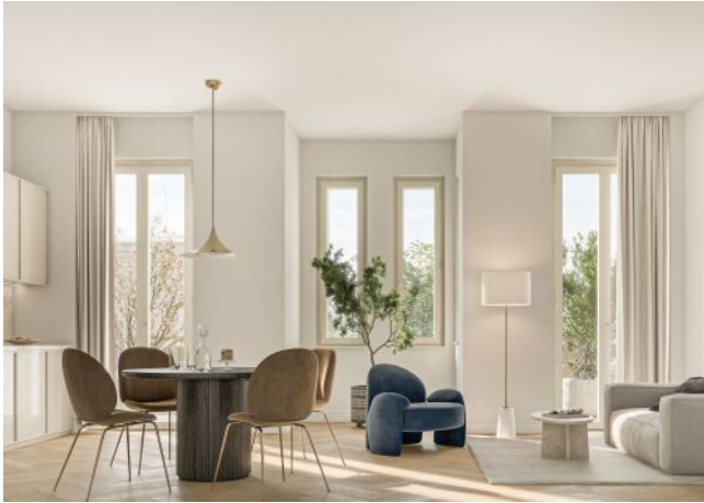
Ausstellungsstraße 29 | Wohnung RG