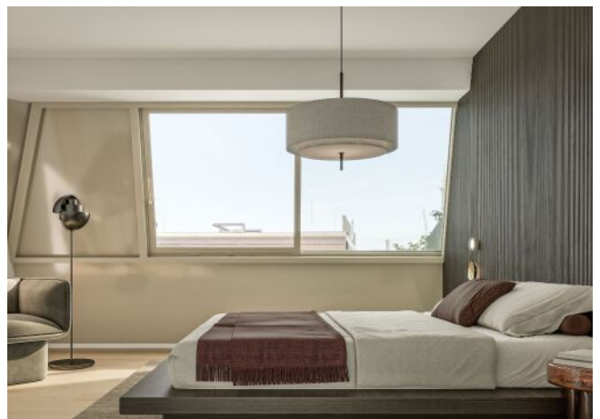
Ausstellungsstraße 29 | Schlafzimmer DG