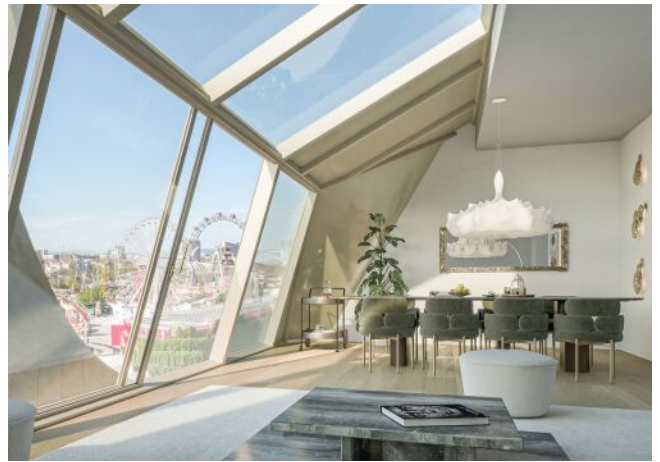
Ausstellungsstraße 29 | Wohnung DG