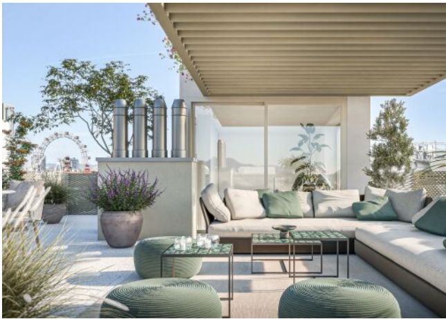
Ausstellungsstraße 29 | Dachterrasse