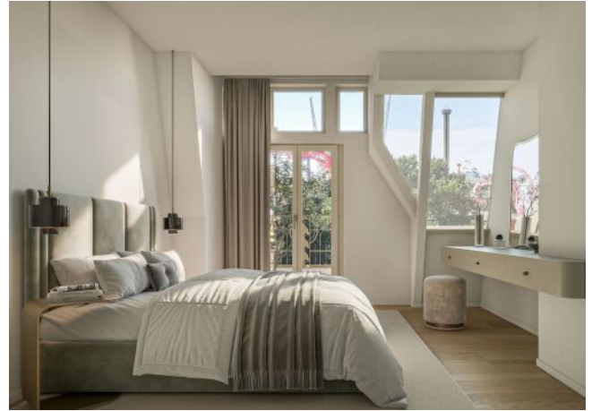
Ausstellungsstraße 29 | Schlafzimmer RG