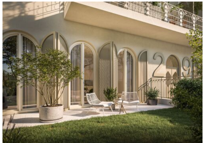
Ausstellungsstraße 29 | Garten