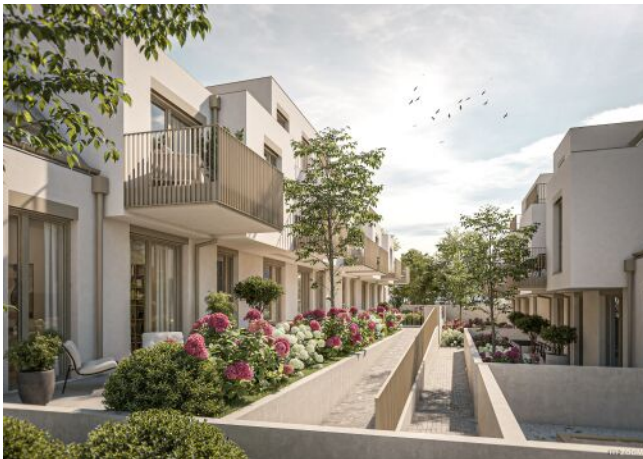
Mautner-Markhof-Gasse 65 Hof