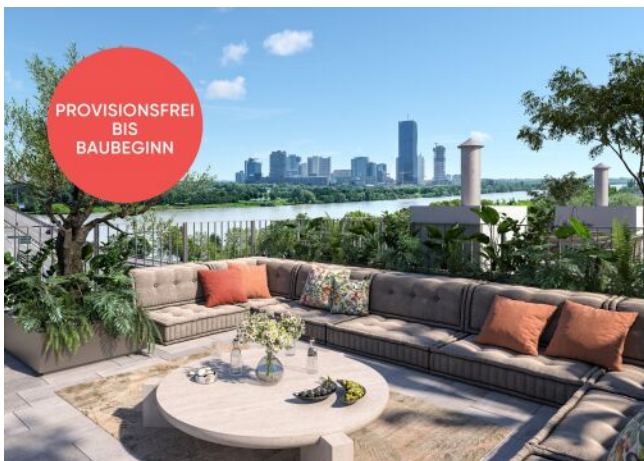
Traisengasse 20-22 | Dachterrasse