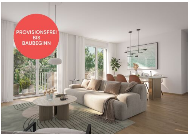
Traisengasse 20-22 | Wohnraum