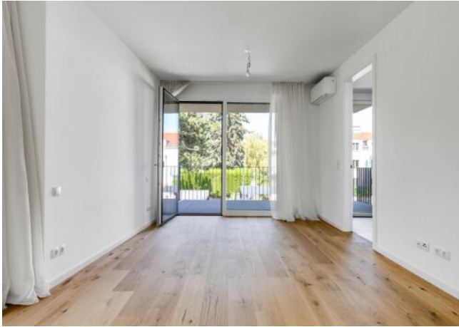
Unterer Schreiberweg 49 | Wohnraum