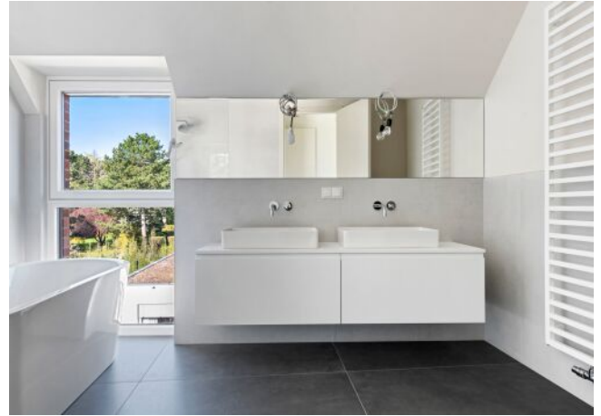
Unterer Schreiberweg 49 | Badezimmer