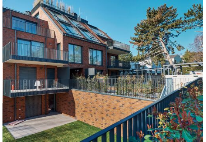
Unterer Schreiberweg 49 | Fassade