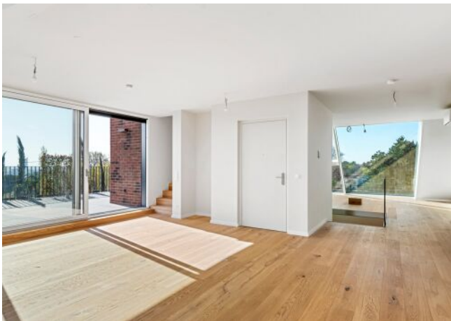
Unterer Schreiberweg 49 | Wohnraum