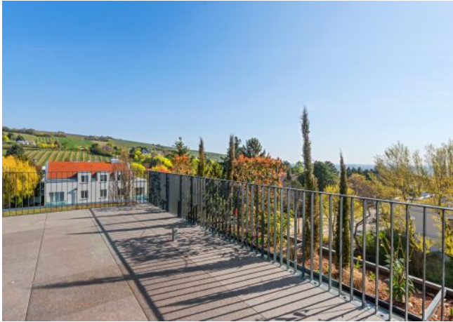
Unterer Schreiberweg 49 | Ausblick