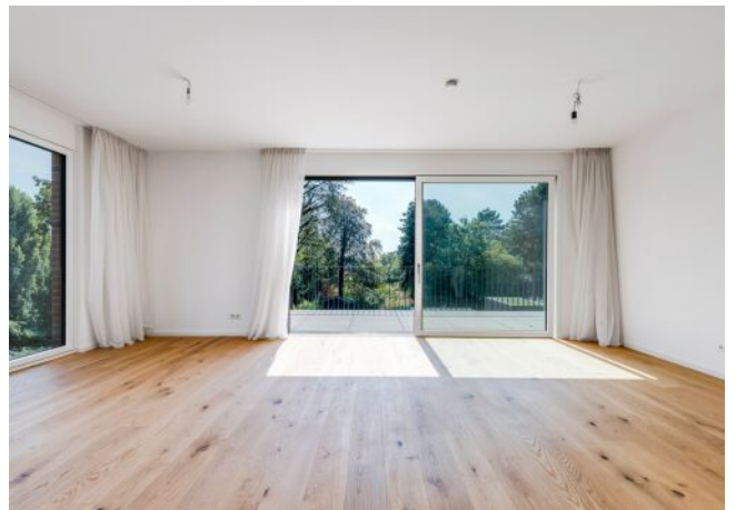
Unterer Schreiberweg 49 | Wohnraum