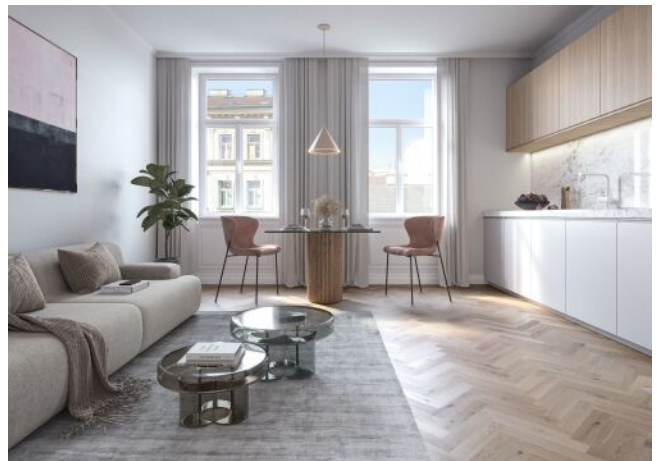
Vivienne | Wohnraum