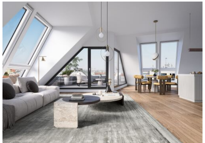
Vivienne | Wohnraum