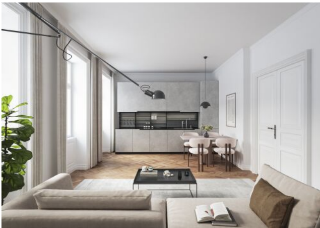
Vivienne | Wohnraum