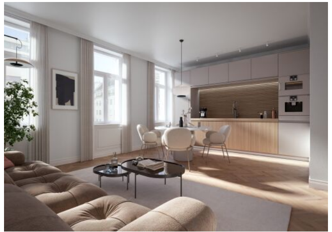
Vivienne | Wohnraum