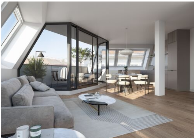
Vivienne | Wohnraum