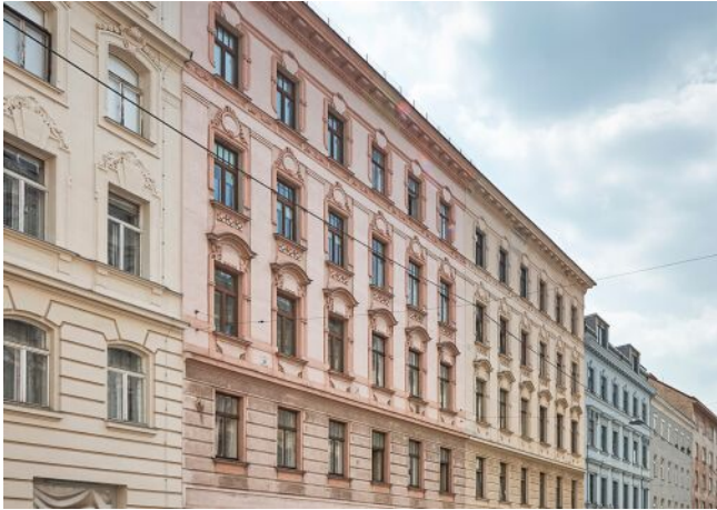
Liechtensteinstraße 128 | Fassade