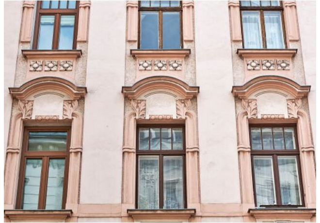
Liechtensteinstraße 128 | Fassade