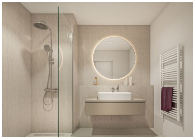
Margaret_Bad mit Dusche V1