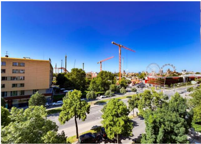
Ausblick 3. OG