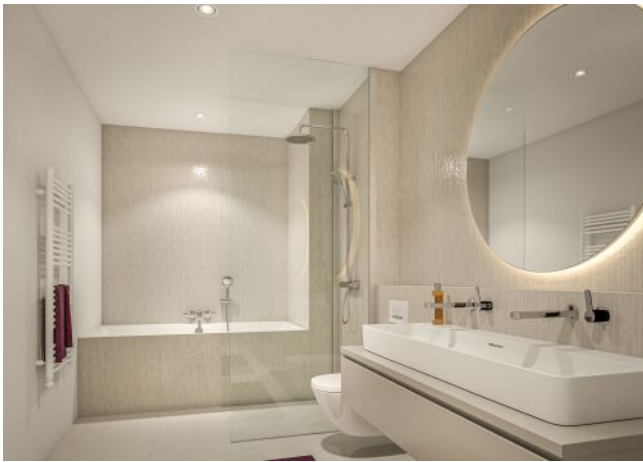
Margaret_Badezimmer Variante 1