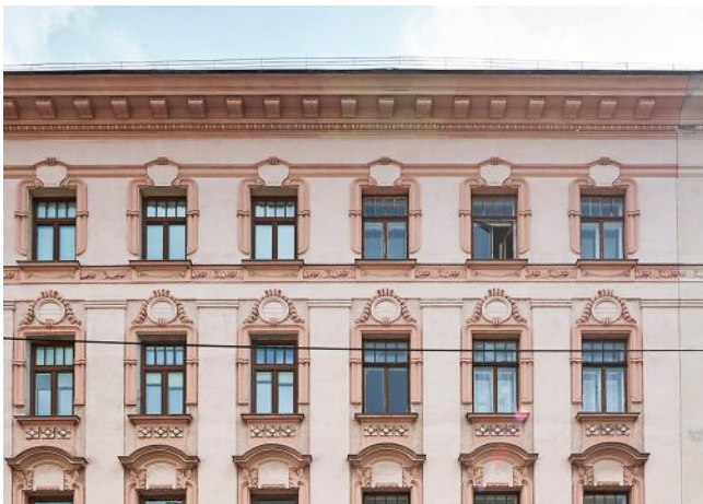
Liechtensteinstraße 128 | Fassade