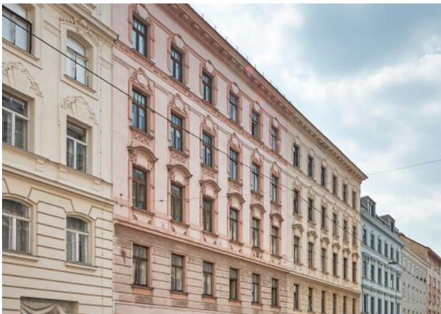
Liechtensteinstraße 128 | Fassade