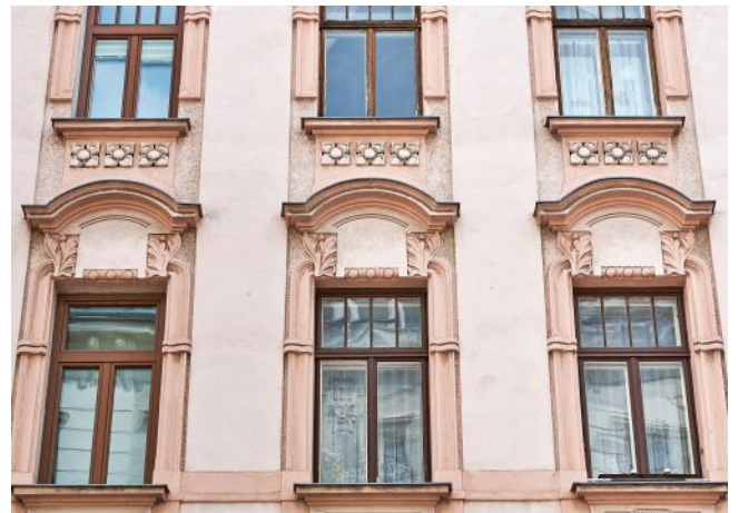
Liechtensteinstraße 128 | Fassade