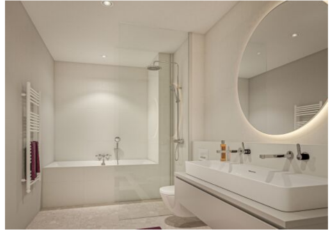
Margaret_Badezimmer Variante 2