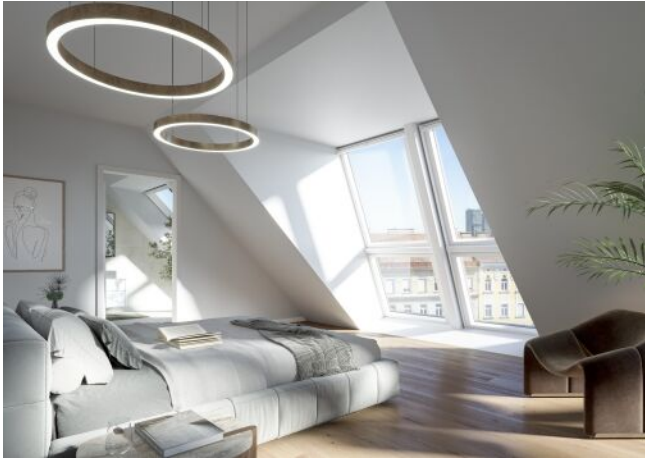
The Legacy | Badezimmer Dachgeschoss