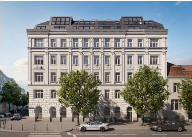
The Legacy | Fassade