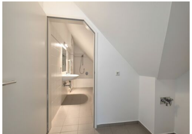
Badezimmer mit Wirtschaftsraum