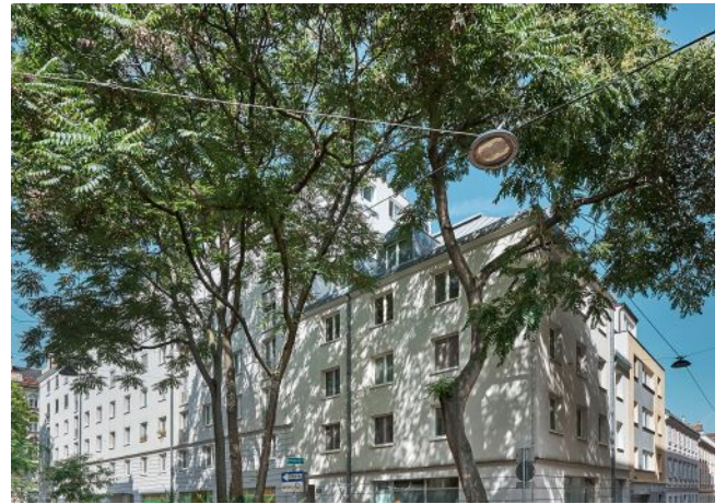
Schaffergasse 18-20 | Fassade