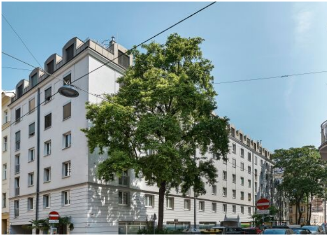
Schaffergasse 18-20 | Fassade