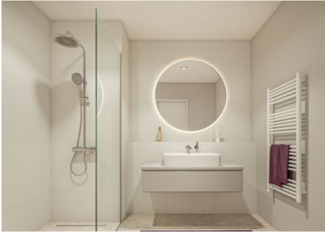
Margaret_Bad mit Dusche V2