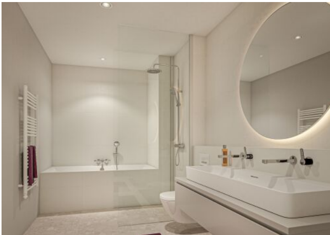
Margaret_Badezimmer Variante 2