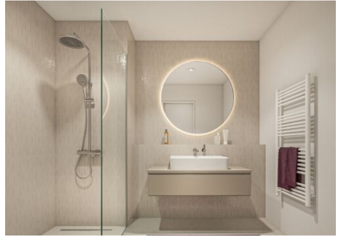
Margaret_Bad mit Dusche V1