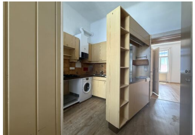
Vorraum / Küche