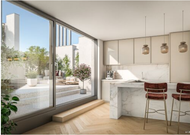
Wohnküche & Terrasse T34