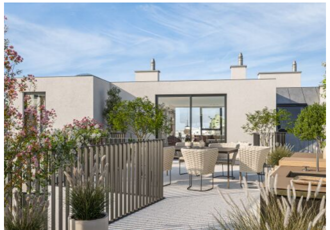
Terrasse Top 21