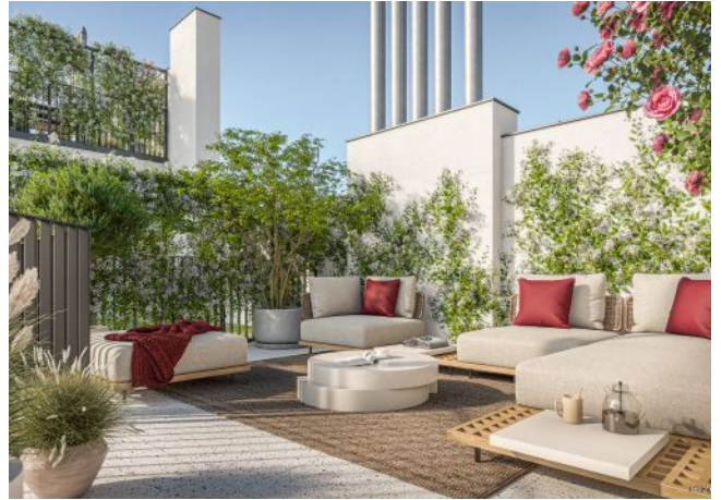
Terrasse Top 34