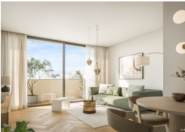
Wohnzimmer Top 20