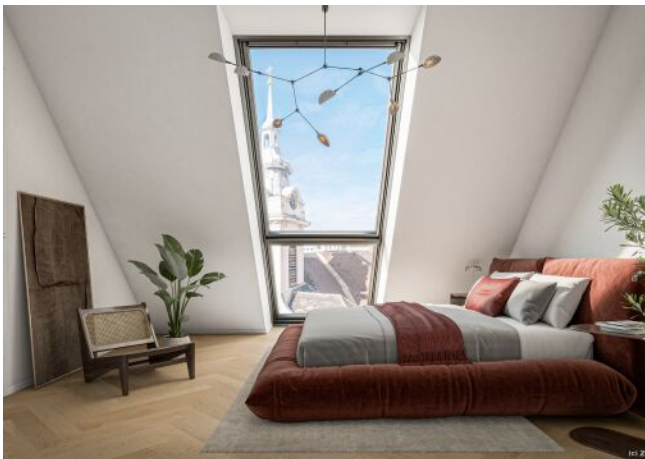
Schlafzimmer Top 21