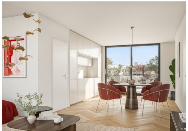
Wohnbereich Top 21